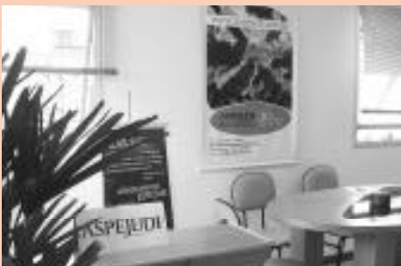
A sede foi totalmente estruturada para receber os seus associados